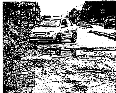
Na Avenida da Saudade, grande buraco prejudica tráfego de veículos

O Estado entrou em contato com a Prefeitura de São Luís para saber as medidas para resolver os problemas, mas até o fechamento desta edição não obteve retorno aos contatos.